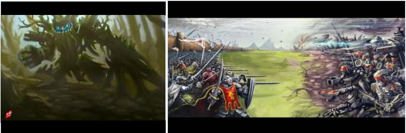
ilustrasi untuk game bertema medieval vs future