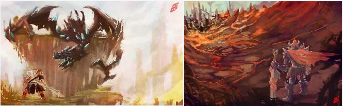
ilustrasi untuk game indie berjudul "Battle Dragon"