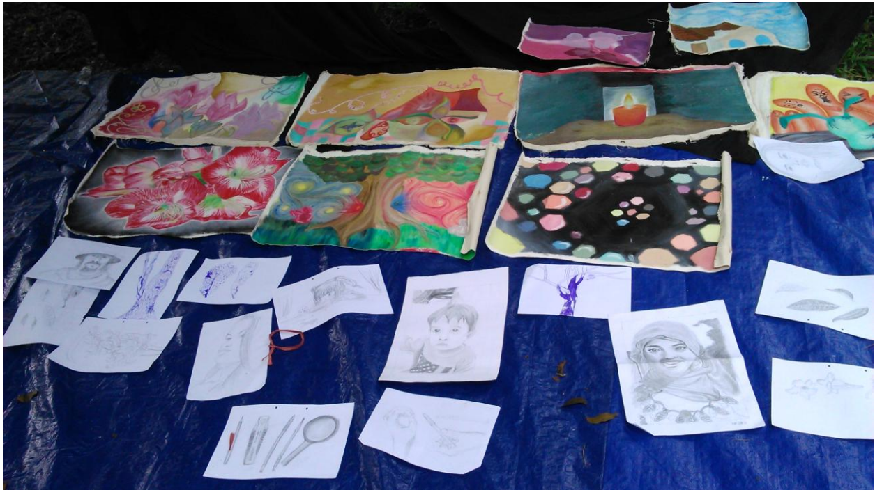
(Pelatihan di alam terbuka)