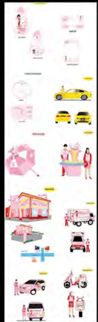
Project S1 Redesign Product Citra (2008)