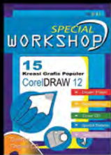
Project S1 Book Design (2008)