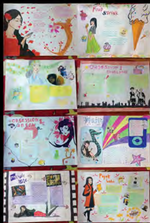
Project S1 Manual Illustrations (2009)