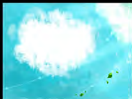
Personal Project (2015)