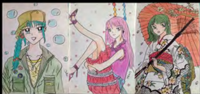
Manual Illustration Original Character (2008)