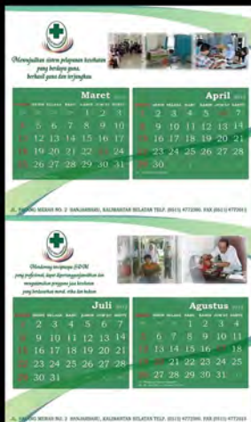
Project Skripsi Calendar (2011)