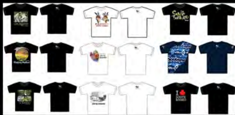
Tiga Dara Souvenir South Borneo T-Shirt (2012)