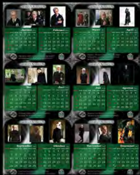
Project Fandom Calendar (2012)