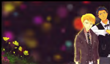
Fandom Project (2015)