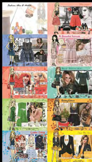
Project Fashion Magazine (2009)