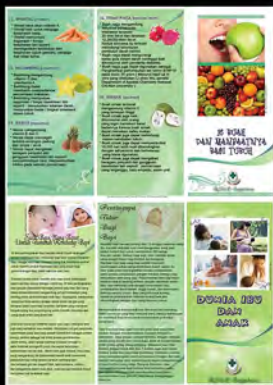
Project Skripsi Info Kesehatan (2011)