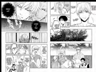
Project Typesetting Manga Kuroko no Basket (2015)