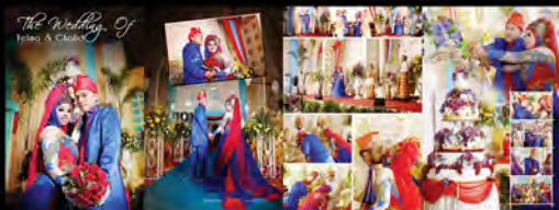
Wedding Album Project (2015)