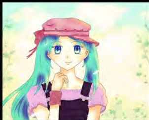
Original Character (2015)