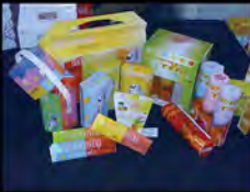
Project S1 Local Food Re-Packaging (2008)