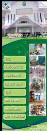
Project Skripsi X Banner (2011)