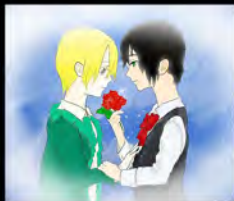
Fandom Project (2014)