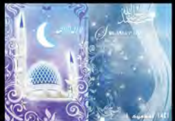
Idul Fitri Greeting Card (2010)