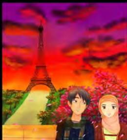
Personal Project (2015)