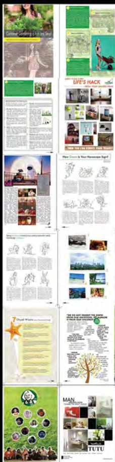
Project S2 Green Magazine (2013)