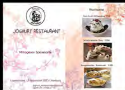
Project S1 Restaurant Menu (2008)