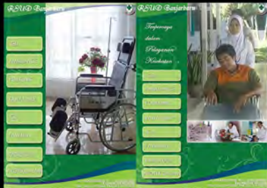
Project Skripsi Baliho (2011)