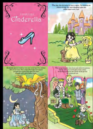
Project Story Book Cinderella (2009)