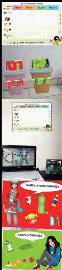
Project S2 EcoFootPrint Personal Solution (2013)