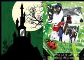
Project S1 Portfolio (2009)