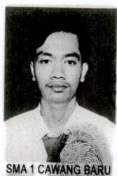
SMA 1 CAWANG BARU

1) Nilai Akhir = 40% Nilai Sekolah + 60% Nilai Ujian Nasional