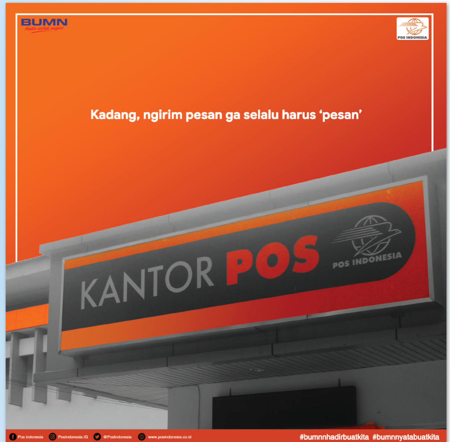
Print Ad ini dibuat untuk Kompetisi COCOfest 2018 dengan tema BUMN

Print Ad ini bertujuan untuk memberitahukan bahwa POS Indonesia bukan lagi hanya sekedar mengirim surat, tetapi bentuk surat lainnya juga.