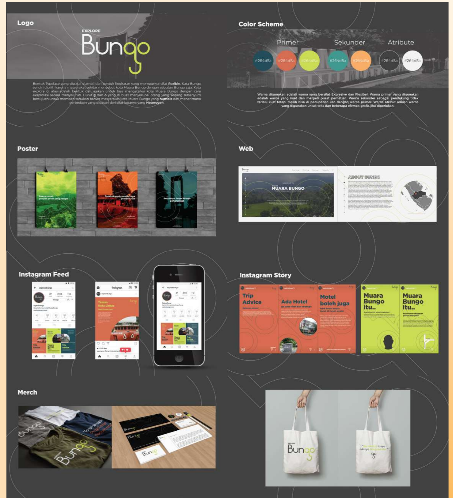
Projek ini dibuat untuk Tugas Akhir

Projek ini adalah projek Tugas Akhir. Bertujuan untuk mengembangkan citra kota Muara Bungo dengan cara City Branding.