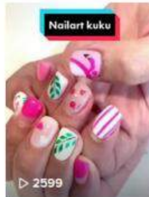
daripada galau mending...