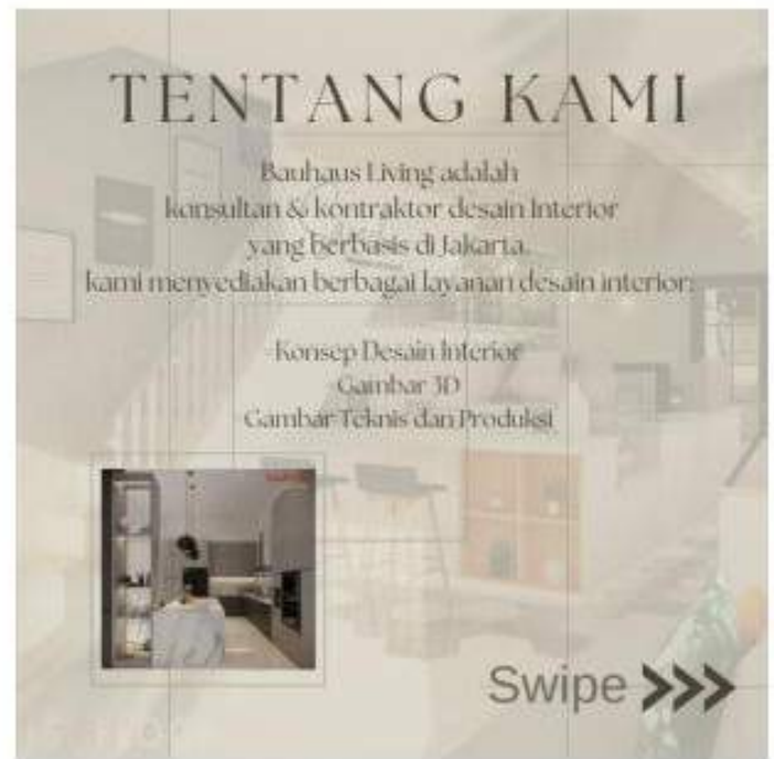
Instagram Post 1080x1080