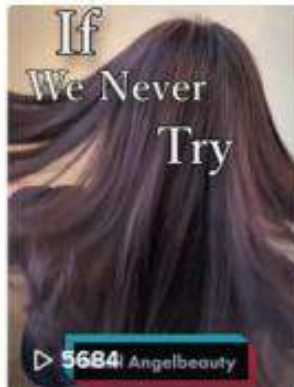
Di jamin bagus dong ay...