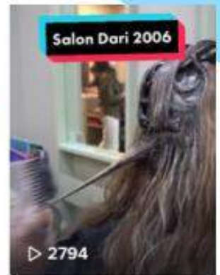
Salon bukan sembarang...