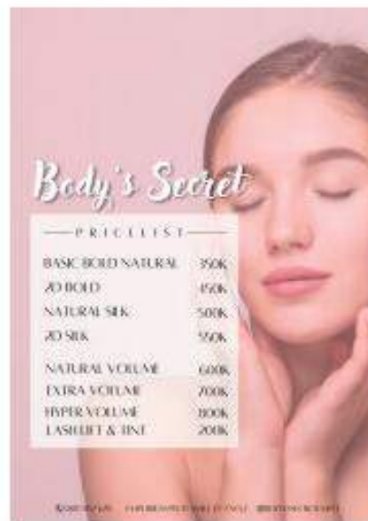
Price List Redesign