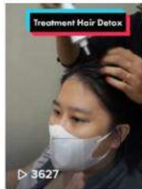
Ngeselin gak sih ketom...