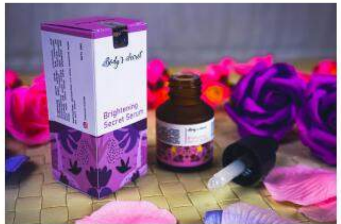
Foto Produk untuk iklan