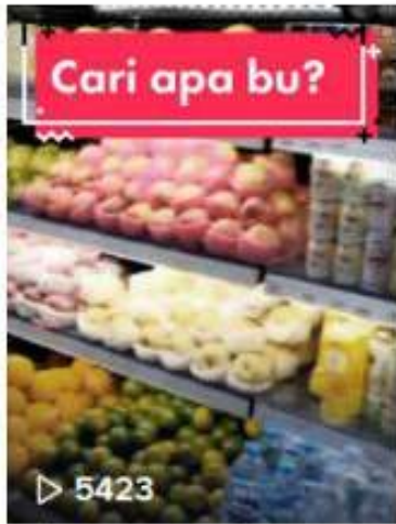
TikTok video production & management