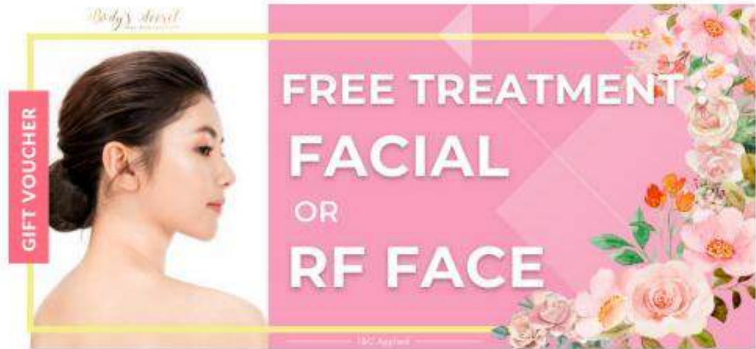
Gift Voucher Design