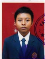
SMK MEDIA INFORMATIKA