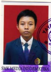
SMK MEDIA INFORMATIKA

dari satuan pendidikan berdasarkan hasil Ujian Nasional dan Ujian Sekolah serta telah memenuhi seluruh kriteria sesuai dengan peraturan perundang-undangan.